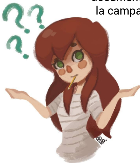
Dibujo cedido por Aryll.

Si muestra interés por tu trabajo es porque sabrá venderlo.